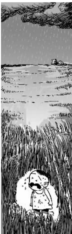
日晒雨淋10天,苦了孩子 漫画 俞晓翔