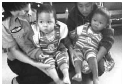
被拐骗的感感(右)与情情比明显黑了好多