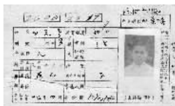
上图:宋美龄当时的户籍卡 左一:平民王志悦的户籍卡 左二:白先勇当时的户籍卡