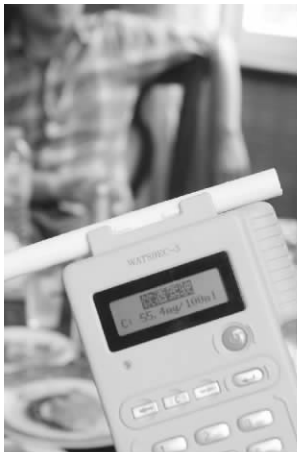
测试表明,网上“酒驾对照表”会误导开车司机

“但不能仗着自己酒量好,就多喝酒。”交警说,酒精在体内的挥发和分解取决于各种因素,比如天