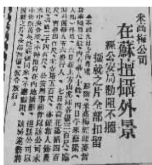
1934年5月10日,《中央日报》刊登了米高梅公司苏州拍片遭扣留的消息

米高梅派人专程到华盛顿的中国大使馆接洽,请求批准来华拍摄外景。等到相关函件经过各个衙门,辗转来到电影检查委员会时,已是1934年初了。可是,米高梅在1933年12月就派导演