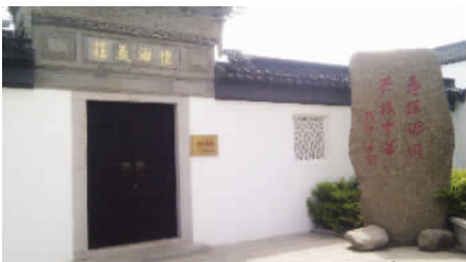
重新修建的怀海义庄

事实上这样的说法道理十足。当我们把眼光从七房桥扩大到无锡全境,我们就会惊讶地发现,原来与钱穆交往甚密的钱基博也是钱氏后人,钱基博的儿子钱钟书,也是鼎鼎大名的人物,这一支同样也有院士——钱钟书的堂弟钱钟韩也是中科院院士。再加上钱逸泰、钱保功、钱鸣高等几乎都是同时代的无锡籍院士,无锡钱氏院士要超过10人。如果再把范围扩大,这个名单还将包括钱玄同、钱永健、钱三强等等。夸张一点说,《钱氏家训》几乎将钱氏家族打造成了学界“豪门”。