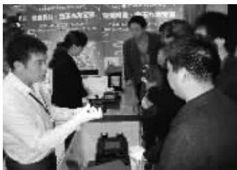
和田玉金瓦宝玺火爆发行现场