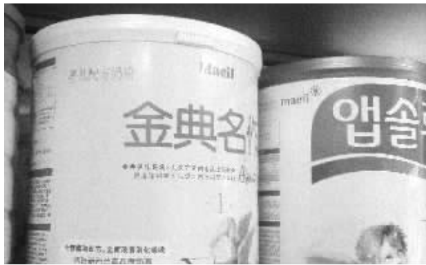
南京一家商店里的“金典名作”奶粉

韩国第三大奶制品生产商每日乳业近日曝出“甲醛门”,进口的饲料中被检出含有福尔马林(即甲醛水溶液)。而记者走访南京市场发现,每日乳业多款奶粉在南京有售,但销售人员表示,奶粉是以新西兰的牛奶为原料,用韩国的先进技术加工,未受到“甲醛门”影响,可以食用。