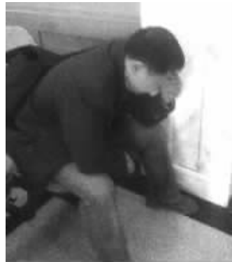
死者家属悲痛不已

死者的家属认为,受车祸这件事打击最大的是新郎的父母,由于一天之内仅有的两个子女都没了,老人无法接受这个事实。“我们亲戚几乎24小时看着老人,他们原本住在我外甥女那照看孩子,现在也不让他们住了,怕他们触景生情,我们只是不断地给他们换地方,不断地