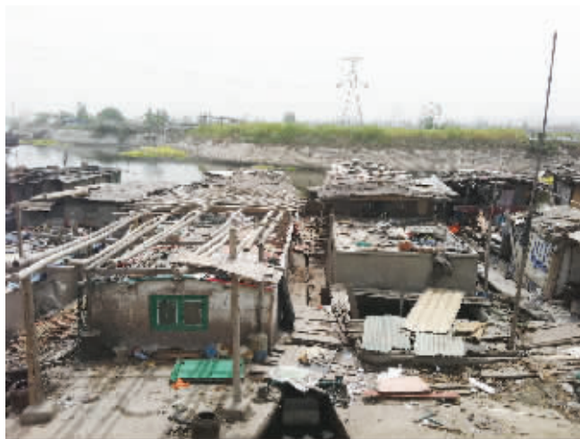
这些住家船非常破旧

正在搞大拆迁,过渡房比较紧张,很多本地的居民都要找房子过渡,也由此导致当地的房租急剧上涨,现在租房价格基本翻了一倍,房源紧张再加上房租上涨,导致很多住家船民不愿上岸。