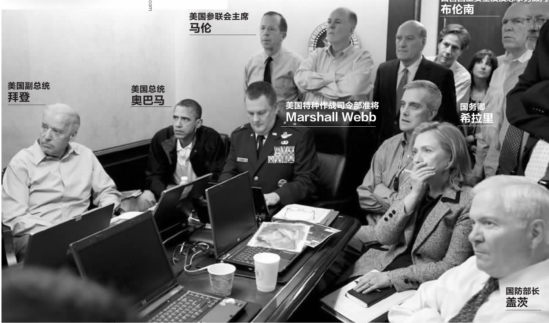
美国参联会主席 马伦