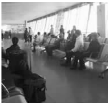
火车站候车室内大量黄牛游说乘客加钱转乘动车

此外,还有市民晒出了火车站候车室内黄牛拉客、小伙直接睡在路边人行道上等众多不文明行为,快报从中选出5幅予以奖励,奖品为每人价值200元的话费。请获奖者拨打现代快报热线96060,联系记者季铨领取。