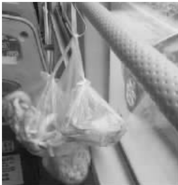
公交车上,乘客把窗帘挂钩拆下挂菜