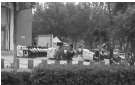
市民蹲在路边石制护栏上