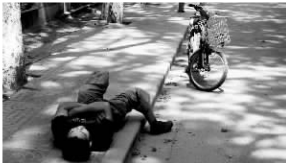
小伙直接睡在路边人行道上