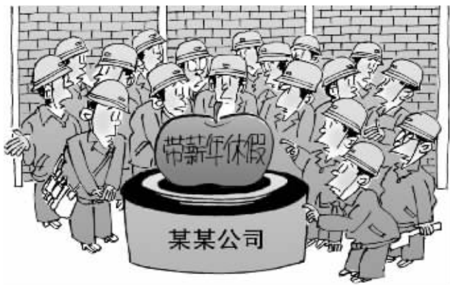
不知何味

——产假。对职场女性来说,不少于90天的产假为她们撑起了法律保护伞,但不少到了生育年龄的女性由于职场压力而犹豫不决。“在我们这一行,能完全享受产假的女性人数实在是太少了。”在一家外资媒体工作的刘