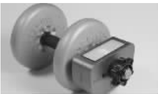
哑铃上有发Twitter的装置

这个东西的意义在于激励你一直运动下去。因为你的所有Twitter关注者都在虎视眈眈监督着你呐。 煎蛋