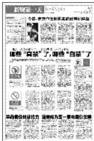
昨天快报的相关头条报道

5月1日0:25,39岁的徐某某驾驶一辆蓝色雪佛兰轿车,在1912酒吧街区被交警一大队查出醉驾,当时吹气检测的结果达到了118.4mg/100ml。随后,交警把徐某某带至鼓楼医院抽取血样,经南京市公安局物证鉴定所检验:送检的徐某某血样呈乙醇阳性,其乙醇含量为108.5mg/100ml,已经属于醉酒驾驶。据记者了解,在南京,如果发生死亡事故的,血检结果会在当天出来,但在例行检查中发现的,血检结果出炉的期限为一个星期。但现在这个过程却加快了,醉酒驾驶的,一律当天就可以获得结果。目前,徐某某已经被采取刑事强制措施。