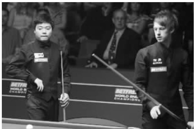
特鲁姆普(右)将是小晖一生的对手

在特鲁姆普眼中,没有人是他的对手,他有极强的好胜心。世锦赛战胜罗伯逊和多特后,特鲁姆普“嚣张”地说:“现在的我,有点无敌的感觉。”战胜丁俊晖后,特鲁姆普表示,他更加觉得自己“无敌”。对于自己的未来,特鲁姆普更是豪言壮语,“我现在知道自己要什么。当我将大多数的心思花在球台上,我相信我可以迎来属于自己的时代。” 快报记者 吕远