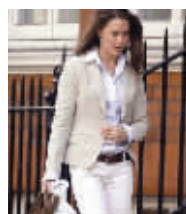
2005年的凯特在伦敦购物