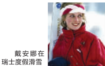
戴安娜在瑞士度假滑雪