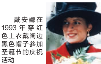
戴安娜在1993年穿红色上衣戴阔边黑色帽子参加圣诞节的庆祝活动