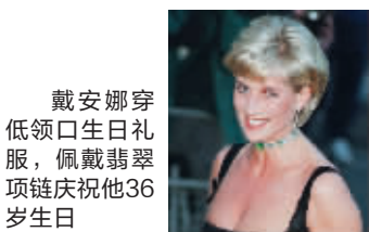
戴安娜穿低领口生日礼服,佩戴翡翠项链庆祝他36岁生日