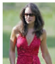
2006年的凯特穿红色白点裙装