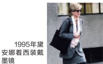
1995年戴安娜穿着西装戴墨镜