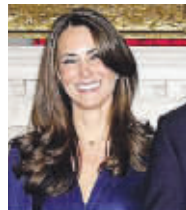
凯特在17日订婚仪式上