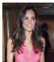
凯特穿优雅的粉红色礼服出席伦敦的一个慈善餐舞会,仅戴了耳坠