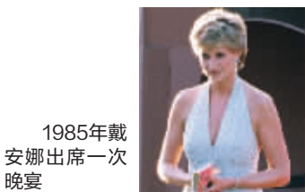
1985年戴安娜出席一次晚宴