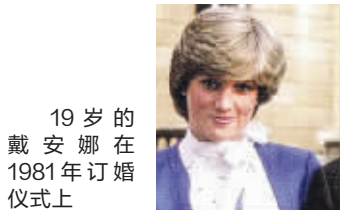
19岁的戴安娜在1981年订婚仪式上