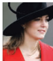
2006年12月凯特穿戴与戴妃相似的服装参加皇家游行