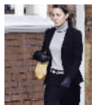
2006年凯特穿着西装购物