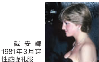
戴安娜1981年3月穿性感晚礼服