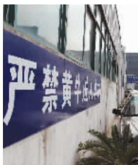
检测站内的标语挡不住黄牛