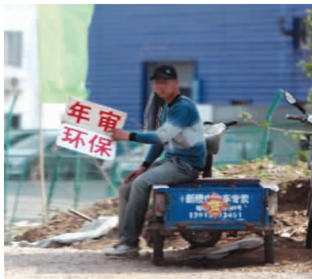
城南机动车环保检测站外拉客的黄牛