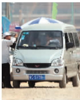
黄牛和车主谈价格