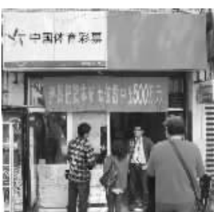
喜。今晚将是该玩法新一期开奖,大家可以继续关注。通讯员 于成莲 快报记者 闫弋

据了解,这个500万大奖已经是本年度我省体彩中出的第60个百万以上大奖,也是7位数玩法本年度为我省彩民送出的第30个百万以上大奖。体彩7位数这棵“常青树”在热情彩民的支持下,持续演绎着不老的神话,不断给彩民带来大奖的惊