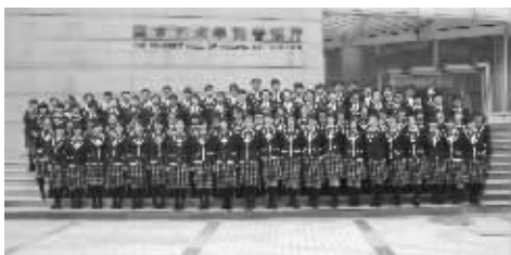
2010年四中合唱团参加鼓楼区合唱比赛获一等奖