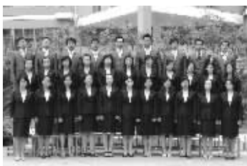
部分市区优秀青年教师合影