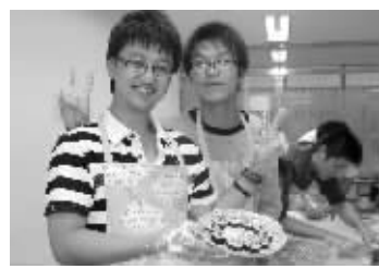
2010年四中韩国又松大学直通班学生暑期赴韩修学生活

答:韩国又松大学位于韩国第二行政首都大田。韩语班学生在完成中国高中学生必须修完的其他课程基础上,开展以韩语学习为主的选修课,韩语课程由又松大学提供,又松大学派驻韩语教师任教,学生达到韩语三级水平,由四中校长推荐,就可直接进入又松大学本科学习,不参加国内的高考;如果学生雅思成绩在6.0以上,由四中校长推荐,直接上又松大学国际商学院学习(由欧美教师全英文教学),同样可以不参加国内的高考。又松大学每年学费3万,生活费1万多。根据学生韩语考试成绩及雅思考试成绩,第一年可以享受减免40%-80%学费的奖励。学生毕业后,又松大学可推荐学生到韩国驻中国的各大企业就业。又松大学直通班高二年级成立,每个年级韩语班都有三名又松大学教师任教。经过一年半的学习,保证学生升入韩国又松大学时语言方面顺利衔接。