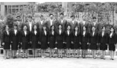
特级教师及部分市区学科带头人合影