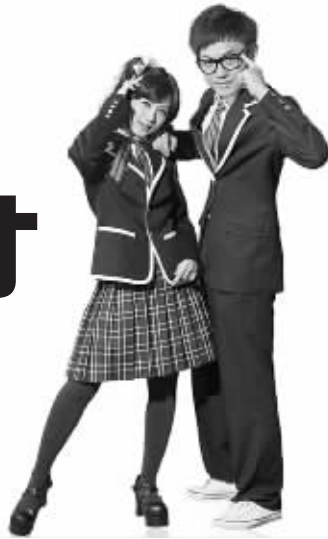
传媒展示四中校服

在风景优美的乌龙潭公园旁边、紧邻地铁二号线汉中门站,有一所闹中取静的校园——南京市第四中学,这所创办于1929年的学校已有八十多年的历史,是江苏省重点中学、首批三星级高中、省德育先进学校、省青少年科技教育特色学校、省现代教育技术实验学校。学校依据多元智能理论,确立了“差异教育、特色发展、多元成才”的办学理念,以学生发展为本,为不同层次、不同特长、不同需要的学生提供个性化的服务,搭建多元化的成长平台,为高校输送多元化的人才。那就让我们一起走进校园,去看看吧——