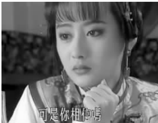
网友根据《梅花烙》中吟霜的形象发明出荡漾体