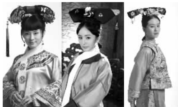
从网络小说到改编而成热门电视剧都很“虐”