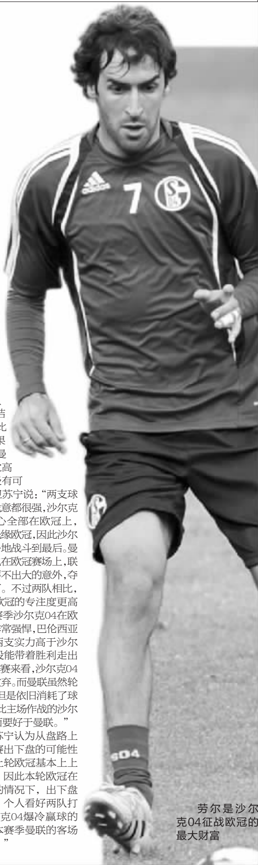
劳尔是沙尔克04征战欧冠的最大财富