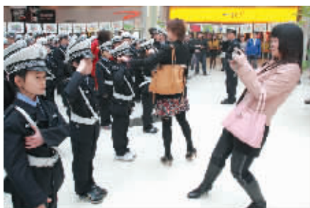
9:40 南京市少年交警队成立现场,影友抓拍少年交警的风采