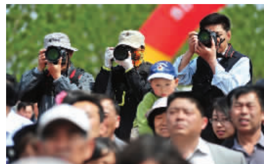
13:46 影友在2011年“和谐江宁大舞台”开幕式上拍摄