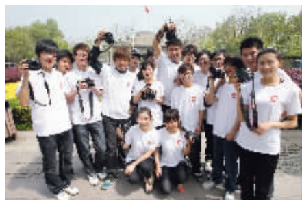
10:00 同学们在总统府前定格自己的开机仪式