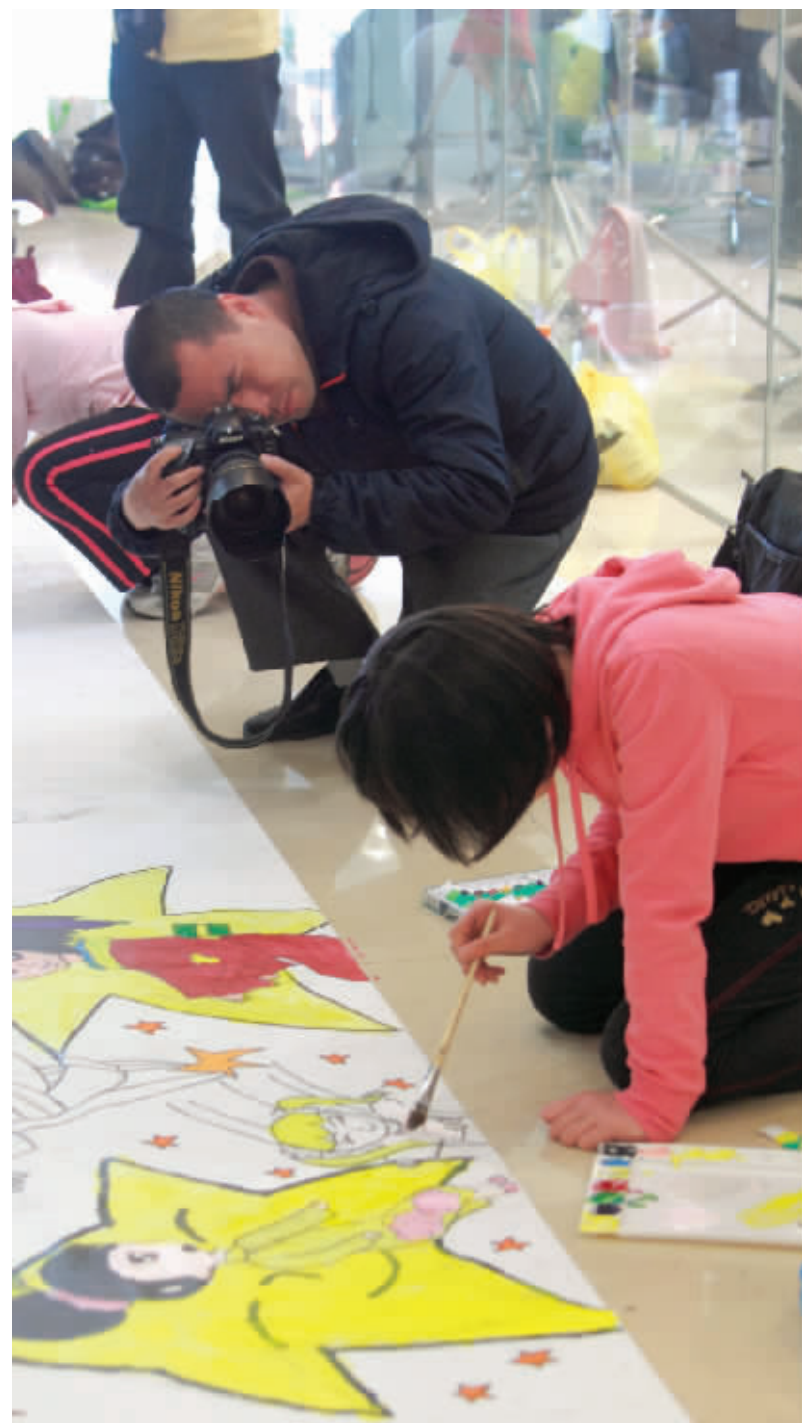
9:30 下关2014米长卷少儿绘画活动现场,影友在拍摄小画家