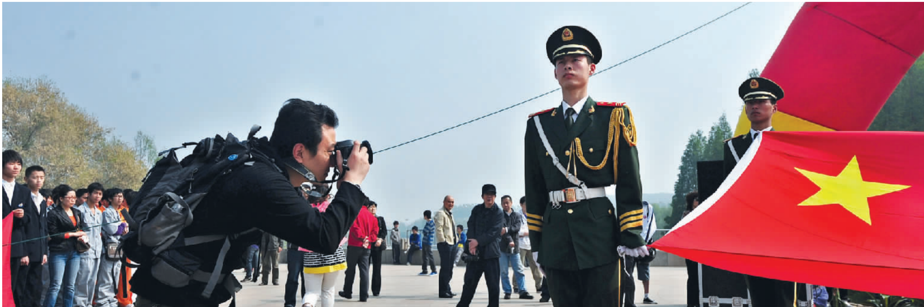
9:11 影友在全市青少年18岁成人宣誓仪式上拍摄