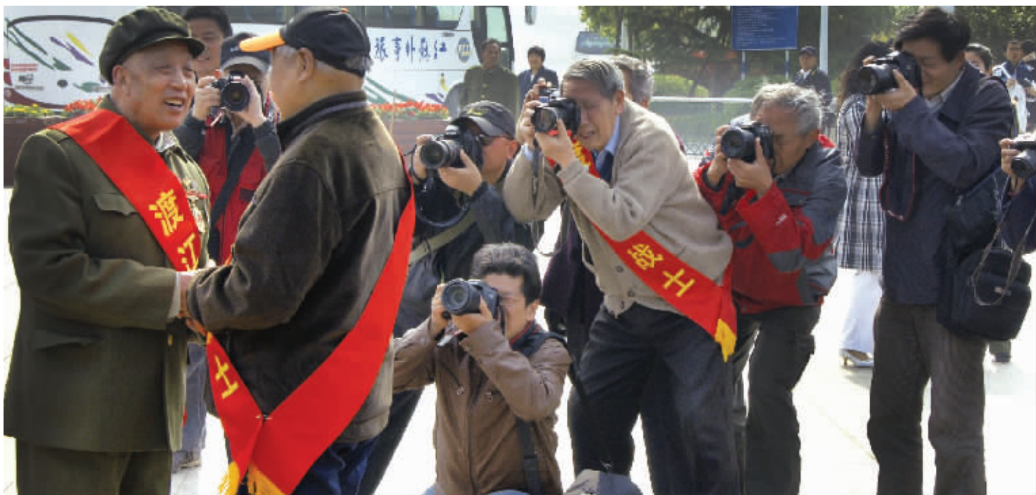
9:00 渡江胜利纪念馆前,老战友相逢,被大批影友包围