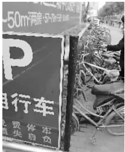
云锦路站现有的一处免费停车场