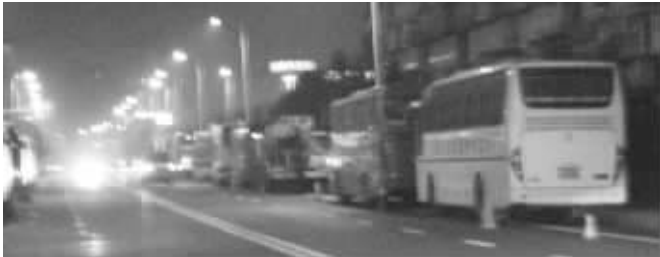
马路成了停车场

乱停放的不止汽车,还有自行车、电动车。有市民在微博上晒出了一张照片,图中两辆自行车随意地停放在路边,而地面上清清楚楚地写着“禁停”两个大字,而这两辆自行车正好就停放在两个大字上。