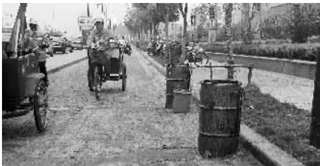
慢车道的泔水放倒很多骑车人