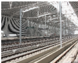
京沪高铁苏州段主体工程已完成