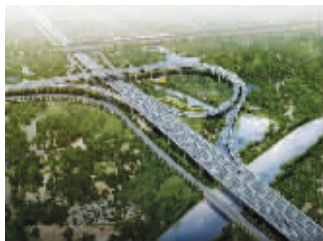
京沪高铁快速路建成效果图