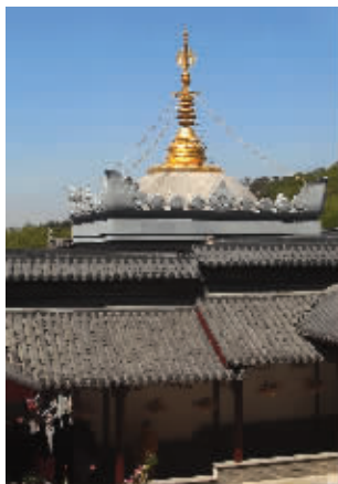
崇光塔金灿灿的塔尖

崇光塔的塔门完全是银行金库大门的标准,外观的石材则是从有名的花岗岩产地山东石岛运过来的。而金色的塔刹则采用了南京金箔厂的两万张金箔。整个崇光塔的造价为200万元。