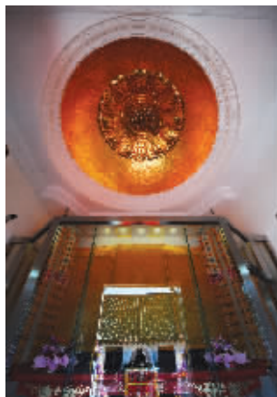
崇光塔内部金碧辉煌