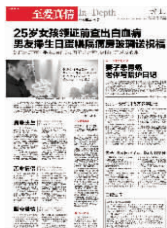
快报4月7日封15版报道