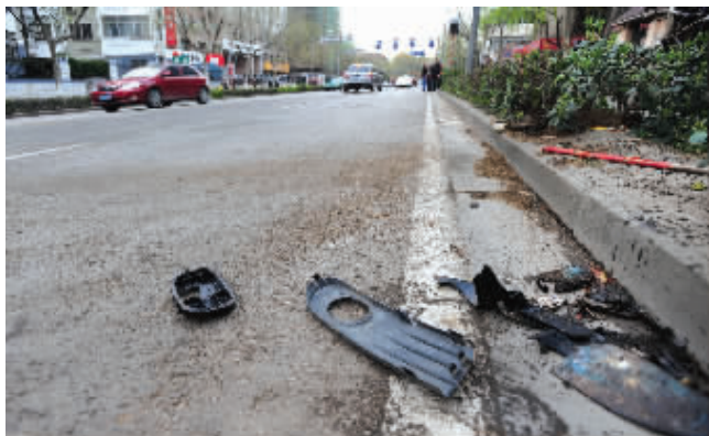
车祸现场遗留下来的汽车零部件

“那辆红色小车实在太快了!”昨天傍晚5点多,记者赶到西康路3号小区门口的时候,车祸现场已经撤除,一个环卫工人正在用沙子清理路上的油渍。绵延50多米的油渍见证了当时车祸的激烈。