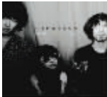
刺猬 《甜蜜与杀害》 评分:★★★★☆

这张LIVE DVD完整集合了周笔畅的新旧作品,总共31首歌曲145分钟。包括周笔畅在天娱时期的《笔记》,乐林时期的《风筝》《号码》《一周年》《毒蘑菇》《浏阳河2008》,以及在演唱会上翻唱王菲的《迷魂计》、陈奕迅的《浮夸》《爱是怀疑》等。