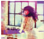
Lenka 《TWO》 评分:★★★★☆

刺猬的标志性明朗旋律在他们的第四张录音室专辑里依旧没有变,但整体感觉更加成熟内敛,直白浪漫不做作的表达方式颇能投合不少摇滚小青年的心头好。除被赋予的历史意味在《杀死你的时代》外,歌词方面依然是刺猬的短板。