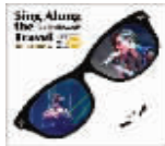
周笔畅 《唱歌去旅行》 评分:★★★★

这张LIVE DVD完整集合了周笔畅的新旧作品,总共31首歌曲145分钟。包括周笔畅在天娱时期的《笔记》,乐林时期的《风筝》《号码》《一周年》《毒蘑菇》《浏阳河2008》,以及在演唱会上翻唱王菲的《迷魂计》、陈奕迅的《浮夸》《爱是怀疑》等。