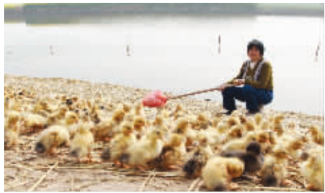
毛茸茸的小鸭披着金色的阳光