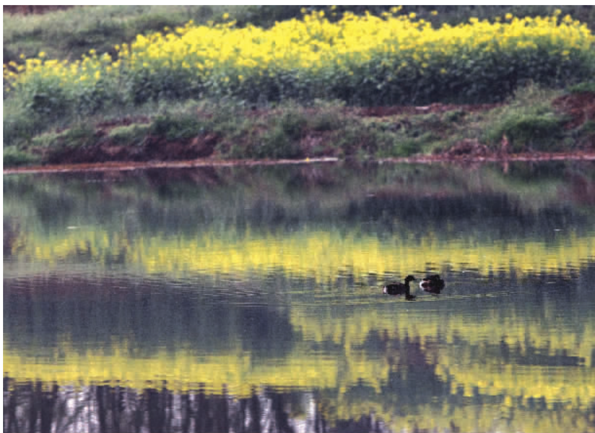
湖水暖和了没有,浮游的鸭子最先知道