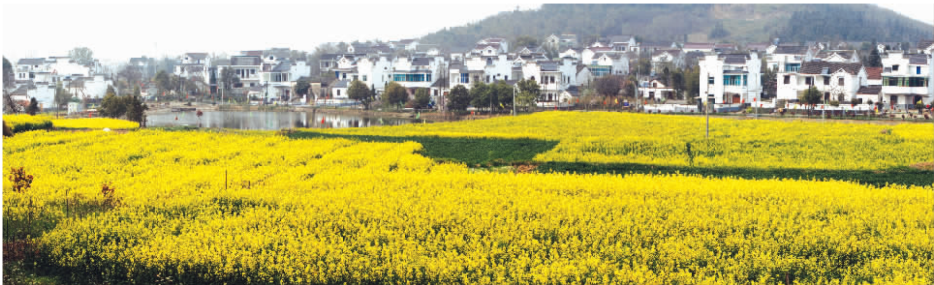
一片片金色的油菜花地掩映着高淳桤溪镇民居,仿佛世外桃源