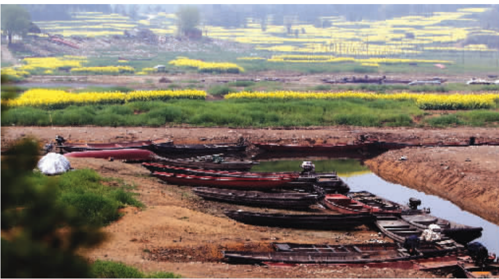
整整一个冬天过去了,湖水干涸了不少,这些搁浅在湖边的渔船正好休息休息