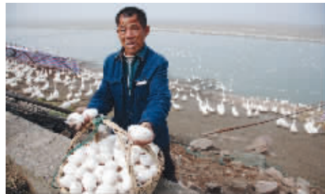
每天都有不小的收获