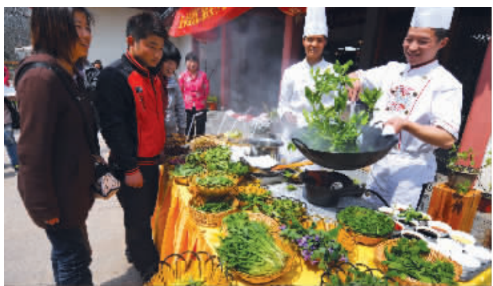
昨天,中山植物园内,厨师在炒野菜

不过,昨天在植物园大家才知道,原来这开出一片蓝紫色小花的野草,不但好看,还是可以吃的“菜”。连花带叶摘下白灼一下,还挺爽口,味道很像油菜或者青菜苔。相传,诸葛亮微服出巡时发现了这种植物,称之为“蔓菁”,此菜浑身是宝,叶子和茎都能吃,吃剩的可制成腌菜,于是下令士兵开荒种这