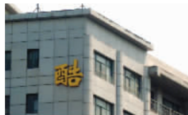
酷啥呢 写个酷字你就酷啦?不知你酷什么。摄于建宁路 (作者倪侃获30元话费)