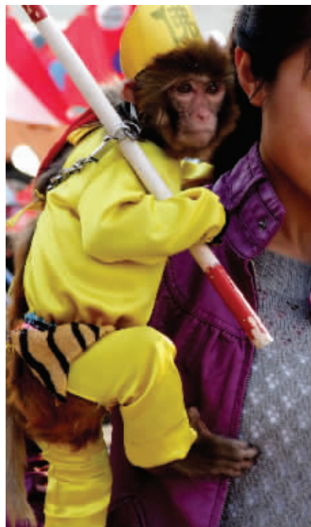
功成名就 猴哥取经回来,功成名就,女粉丝争相合影。摄于燕子矶 (作者苏玉芳获30元话费)