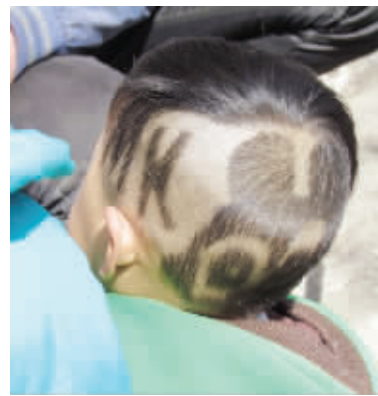
酷头 米奇爬上小脑袋,回头率肯定高。摄于红旗新村