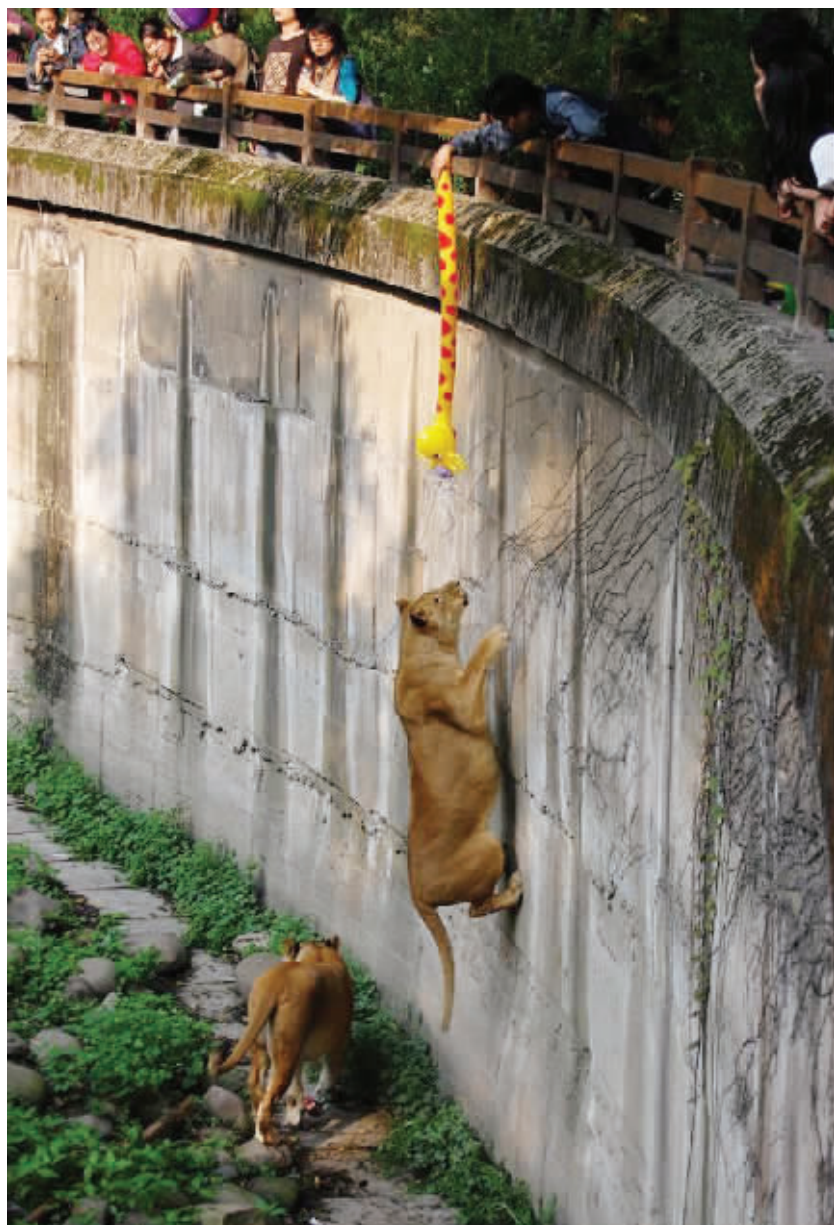
狮子的最大梦想,是能拥有属于自己的一只气球,为此它学会了爬墙。 (作者刘军获30元话费)