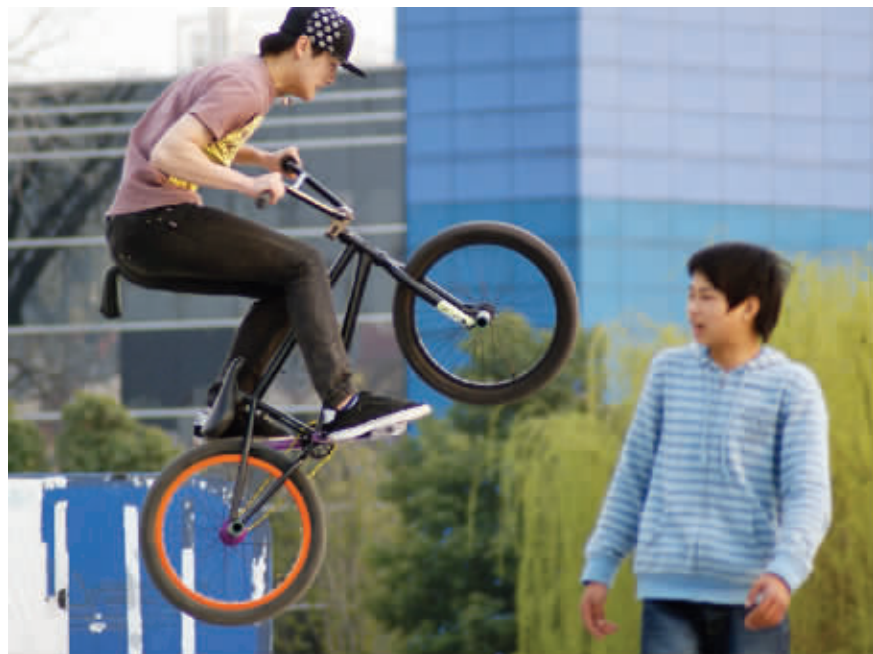
让自行车飞 加油!让自行车再飞一会儿。3月28日摄于南湖 (作者陈丹丹获30元话费)