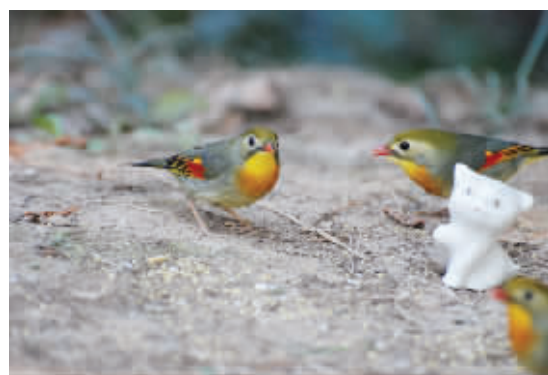
有埋伏? 猫咪真假难辨,小鸟战战兢兢。混口饭吃不容易啊。3月28日摄于玄武湖 (作者吴洪川获30元话费)