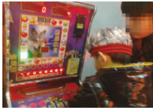
玩笑开大了 额滴个神呐,怎么越看越像赌博机啊。难道这个也要从娃娃抓起?摄于中央门 (作者张庭获30元话费)