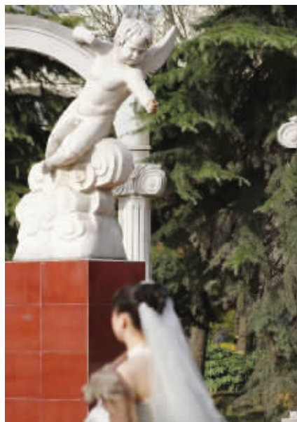
吃饭的家伙丢了 丢了弓箭的丘比特,还是丘比特吗?摄于情侣园 (作者颜英获30元话费)