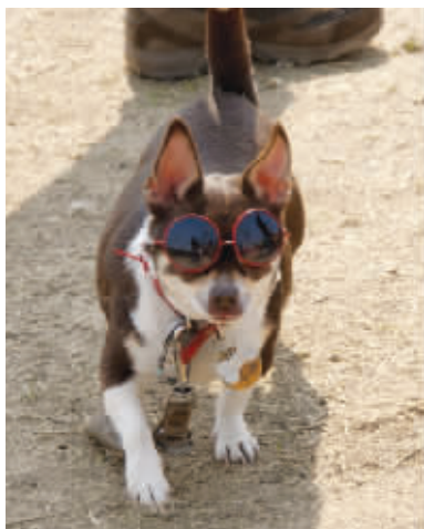
春游去喽 酷狗自带午饭(骨头)野餐去,咦,那边有个MM哎。3月26日摄于琵琶湖 (作者姜双章获30元话费)