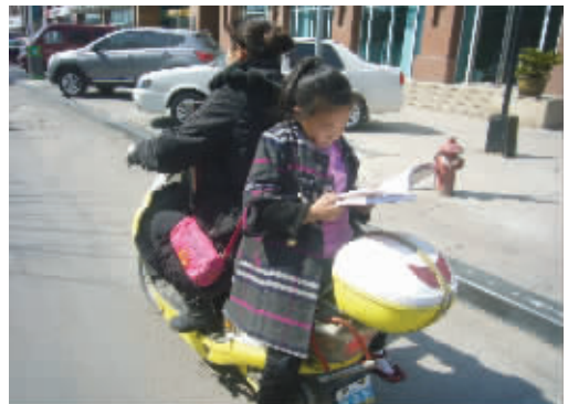
乐读书 上面那位小朋友要好好向这位姐姐学习学习 (作者陈忠群获30元话费)