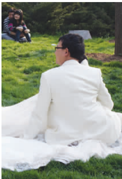
恋爱的季节 这是一个恋爱的季节,大家应该互相微笑,搂搂抱抱这样就好。 (作者陈丹丹获30元话费)