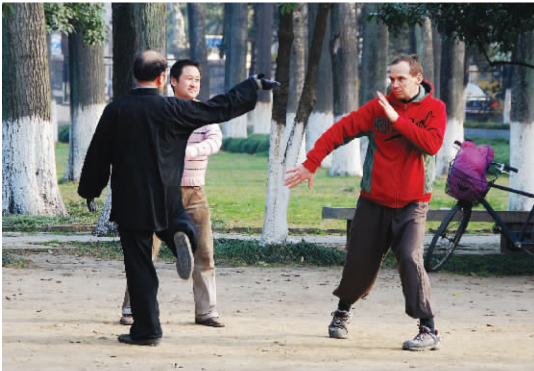
师傅看似不经意的一挥手,老外徒弟压力很大,摆出随时要跑的架势。3月26日摄于午朝门遗址公园 (作者陆如硕获30元话费)