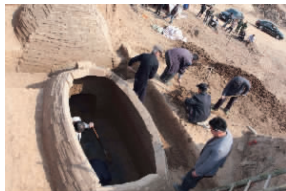
古墓前,工作人员正在清理古墓