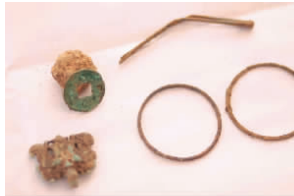
俩银镯,一发簪,一铜钱,一铜铺首