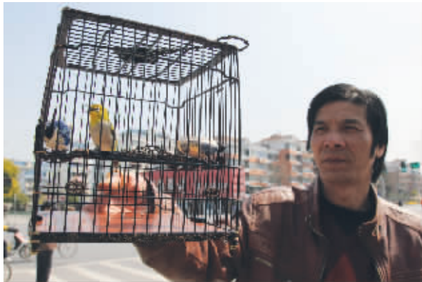
价值三万元的小叶紫檀镶金笼装着连获三次斗鸟赛头名的秀眼