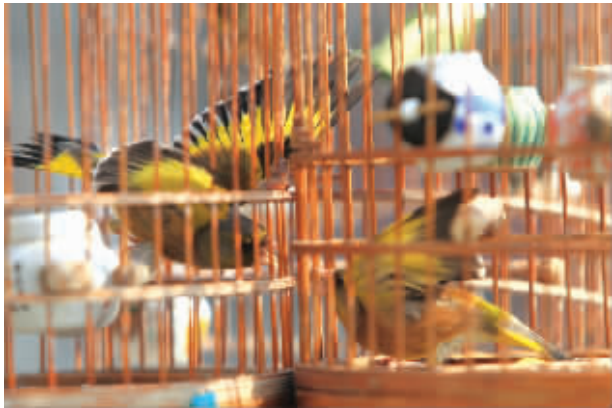
街边公园,两只金翅打斗正在激烈进行中