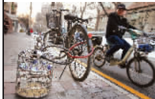
成贤街,人在屋里,鸟笼在户外晒太阳,加把锁是为了防止心爱之物丢失