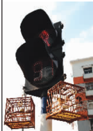
鸟儿鸣叫着为红绿灯伴奏