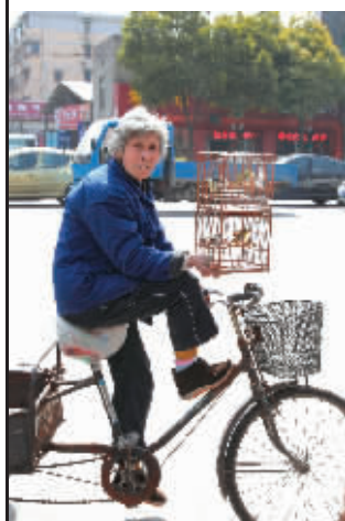
75岁的女雀友骑着三轮车遛鸟,精神抖擞