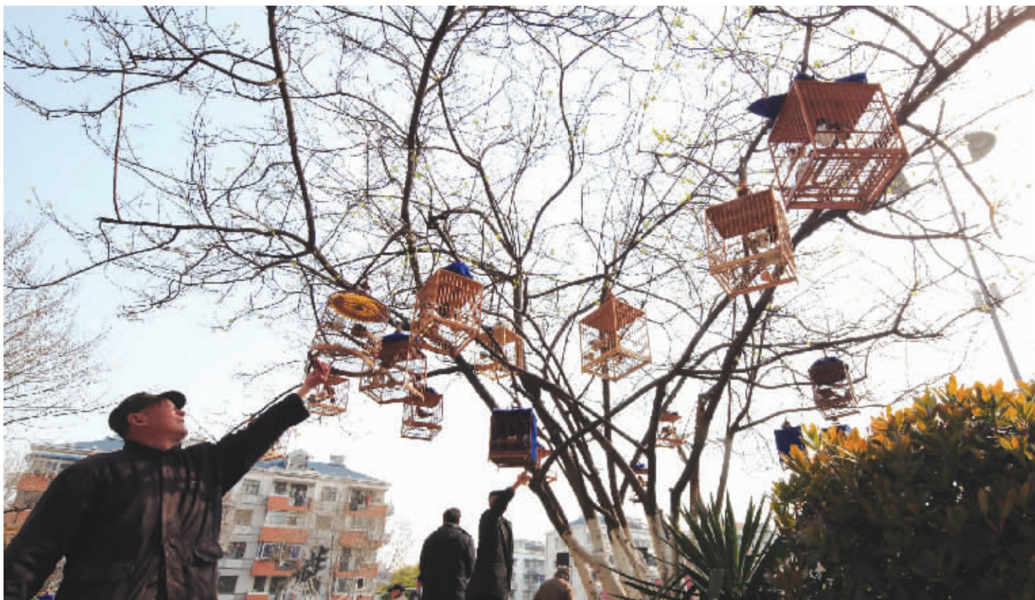
集庆门大街安泰村的一棵树成了鸟儿的天堂

春去了可以再回,花谢了可以再来,只有青春才像小鸟一去不回来。就算是一个版面,也有它生命的轮回。星期柒新闻周刊“最南京/人文”今天收拾门面,更名“写真”,重新开张。欢迎提供您身边的摄影报道线索,可以在新浪微博关注“@星期柒新闻周刊”。