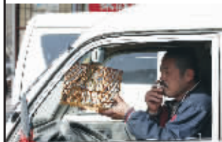
开车都要带着鸟笼,听听鸟叫,这就是生活的享受