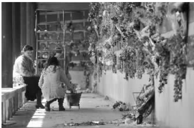
昨天,许多市民来到雨花功德园祭奠故人

入垃圾桶,但是仍有部分市民乱扔垃圾。记者注意到,一名中年女子走到墓碑前,将手中的塑料袋打开后,从里面依次取出水果、白酒、香烟等祭品摆放在供台上,然后将塑料袋扔到墓碑后面。另外两位市民则在祭扫完后,将多余的祭品随手丢在墓地,饭菜和水果则直接倒在了祭祀区。