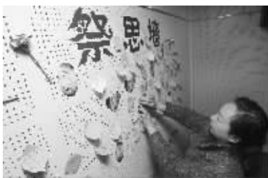
社区居民公祭现场

1993年,温老师重病,且已不能说话。当时,她伏在温老师床头,唱了一首老师教她唱过的歌,老师竟流下泪来。