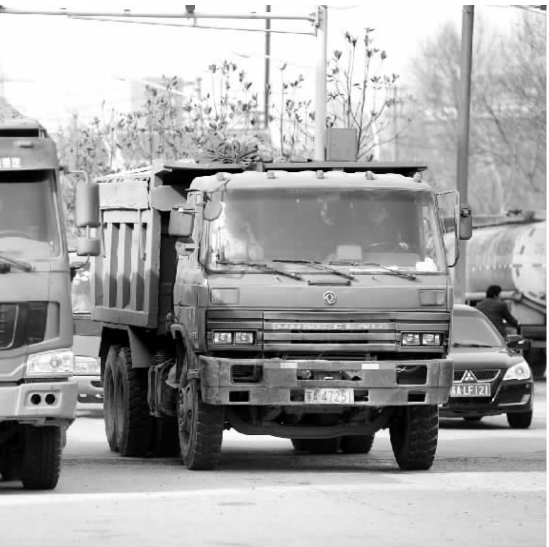
一辆辆渣土车,把主城建设工地上的废渣土经过铁心桥运到别处,铁心桥承载着南京发展之痛