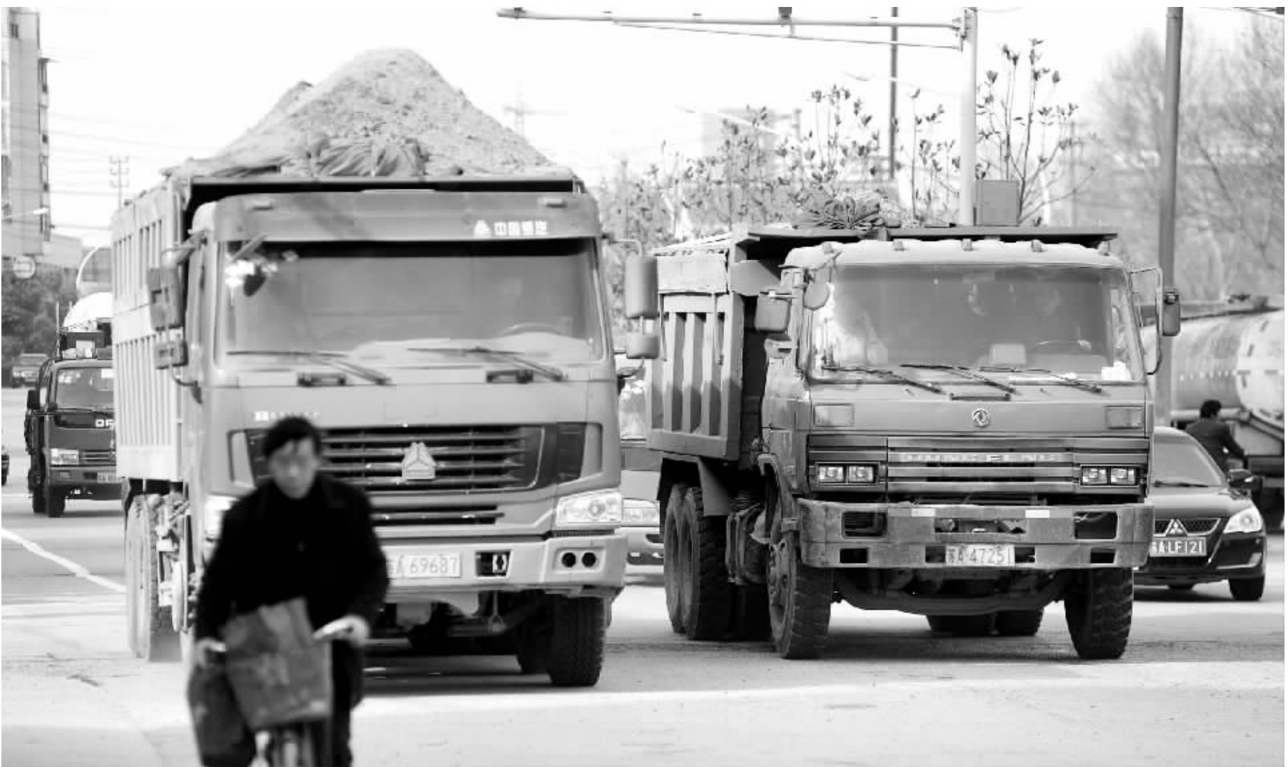
一辆辆渣土车,把主城建设工地上的废渣土经过铁心桥运到别处,铁心桥承载着南京发展之痛

每天都有。”管委会副书记张桂芳带着工作人员铲屎,然而,一些居民却对她动手了。张桂芳算过,自己到景明佳园工作这几年来,一共被居民打过三次,还被关在办公室里整整一天。“那户人家找到管委会来,不让我吃饭也不让上厕所,就是因为了要救济,我们这些工作人员受了很多苦。”