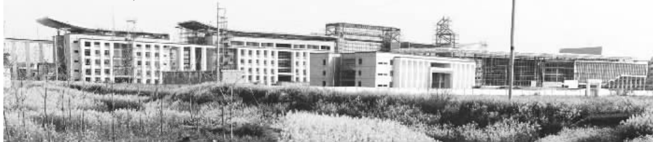
3月25日, 记者拍摄的已经基本完工的望江县办公楼外景

近日, 有网友发帖对地方政府豪华办公大楼进行集中曝光, 其中, 安徽省安庆市望江县作为一个财政穷县竟在建 超过8个“美国白宫”的办公楼。对此, 安庆市联合调查组回应称, 从他们调查结果来看, 办公楼建筑面积不超标, 但确实存在项目审批手续不全、操作不规范、超标装饰等问题。