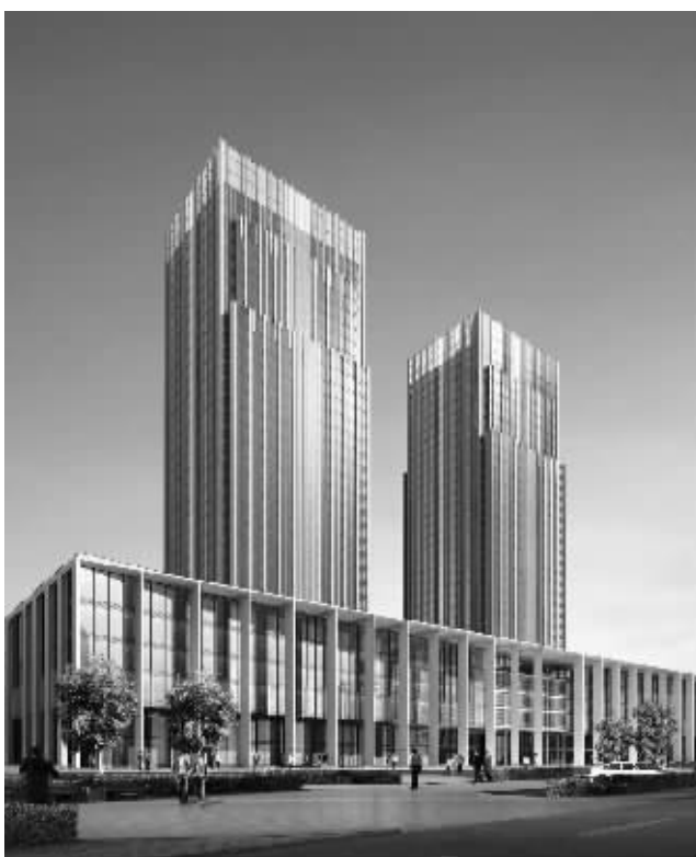
苏州市综合便民服务中心效果图