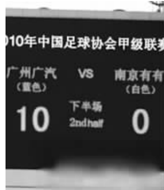
去年中甲0:10输给广州队后,有有爆出“欠薪门” 资料图片