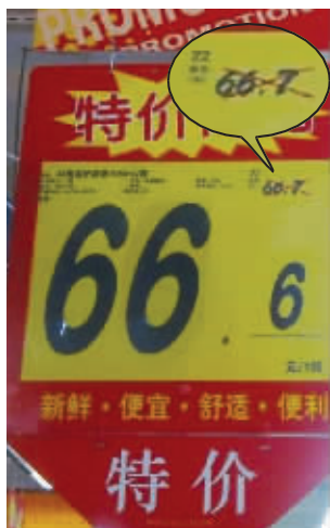
大润发超市特价标牌

昨日，在常州某知名论坛，一则题为“湖塘大润发很给力的促销，原价66.7，特价66.6”的帖子吸引了众多网友的眼球，并且迅速蹿红，升到了论坛首页。发帖人“根深蒂固”说，湖塘大润