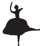
Pet Shop Boys 《The Most Incredible Thing》

这是张很“中国风”但又不落俗套的专辑。歌词很细，典故不少，“花开花落间的爱欲生死”这个主题不好把握，但专辑确实令人回味无穷。作为主打歌的《桂花酿》贵在有所沉淀。“你的笑容藏在我心上”这样的歌词加上流水般的钢琴伴奏，美感良多。