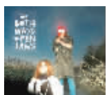
The Do 《Both Ways Open Jaws》

老牌电子组合Pet Shop Boys的这次出招把专辑名定成了安徒生童话的名字“最难让人相信的事”，整张专辑听下来也相当符合一个童话故事应有的脉络，奇异、浪漫和一种老练与童稚交融的气息弥漫其中，不少作品都把电子节拍和古典的钢琴旋律融合在一起。