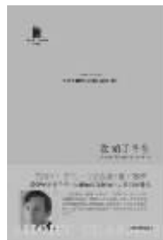
人民文学出版社 2011年3月

布伊的短篇小说集。小说中的人物都站在放弃的边缘——他们沉浸在永远无法成真的梦想,怀念那些早已从他们生活中消失的人。他们游走在这些凄美故事中的街头,直到邂逅陌生人。