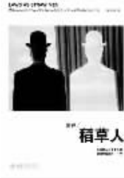
北京大学出版社 2011年2月

清华大学法学院张建伟教授的随笔集。它关注的不是写在纸上的法律真理,而是法律在真实生活中的状态,它嬉笑诙谐的笔头嘲弄的并非法治的理想,而是这样的理想落在现实沙洲上的窘困与无奈。