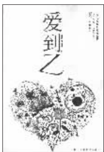
《爱到Z》 上海文艺出版社 2011年1月