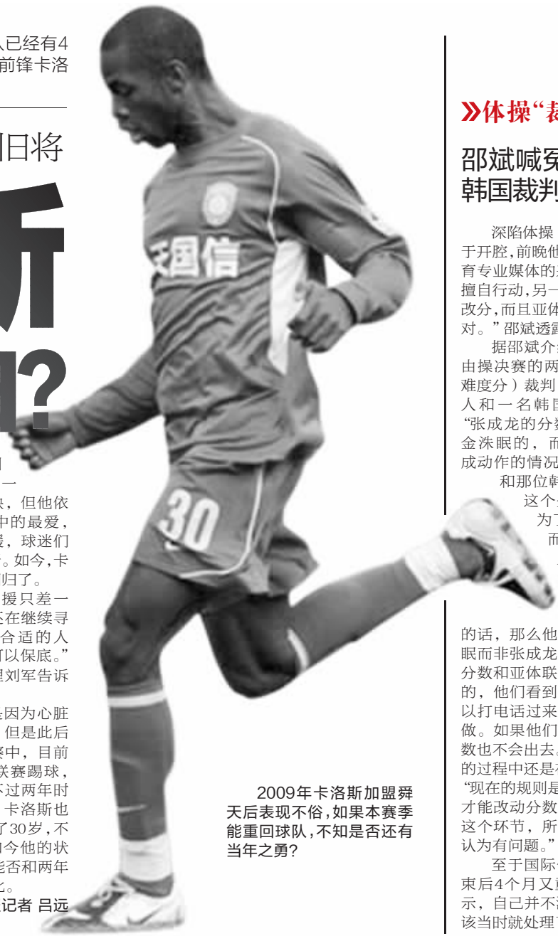
2009年卡洛斯加盟舜天后表现不俗,如果本赛季能重回球队,不知是否还有当年之勇?