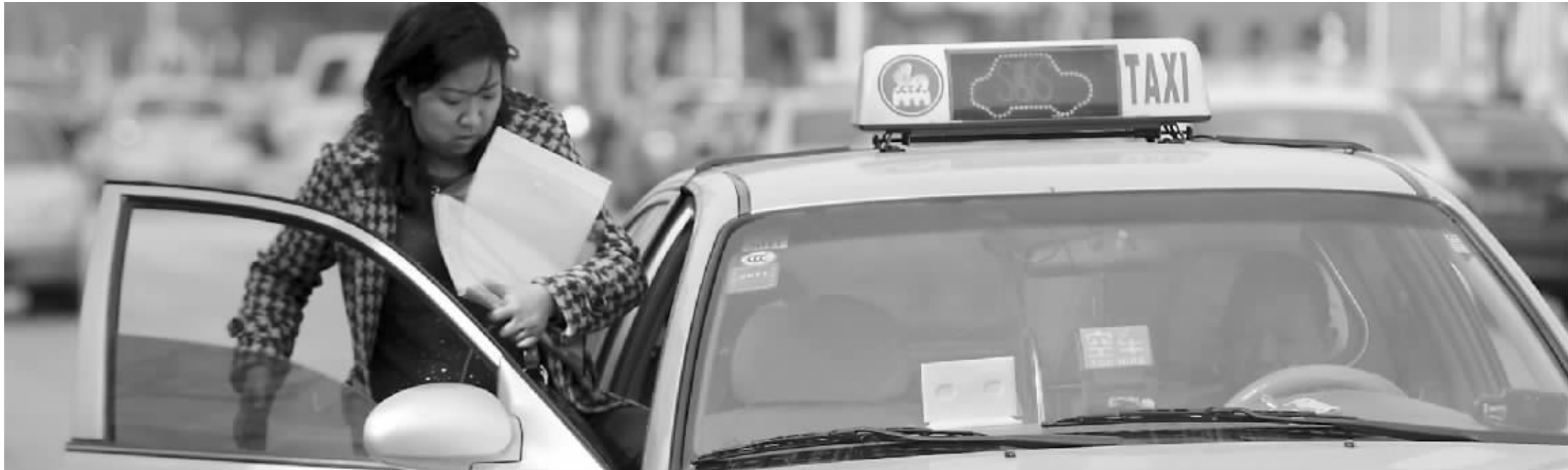
出租车起步价上涨,变为9+1+1元