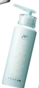
花王SOFINA beauté芯美颜泡沫按摩润肤洁面乳 RMB230/170g