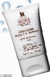
Kiehl's科颜氏 焕白双效清爽防晒隔离乳 SPF30+PA+++ RMB350/30ml