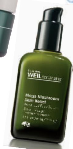
Origins悦木之源 韦博士菇菌亮肤精华乳 RMB880/50ml