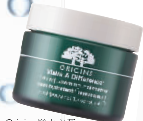
Origins悦木之源 保湿赋活面霜 RMB470/50ml