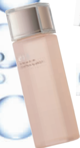
EST媛色菁华焕颜化妆水 RMB420/120ml