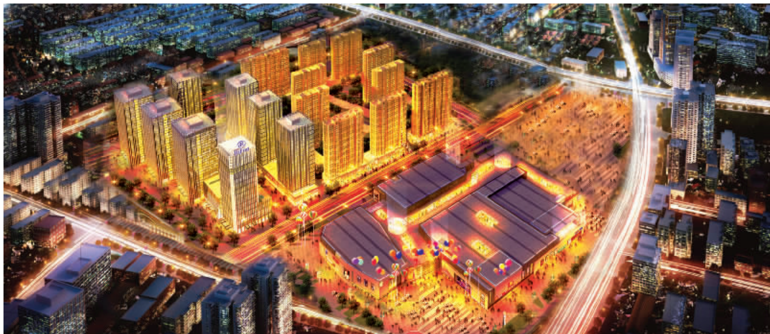
以万达中心为原点,新一轮城市崛起已然发生

8栋商务楼荟萃一大商务中心,总面积超40万平方米,南京此前未有大型商务中心扎根城市综合体,白金五星级酒店助阵,南京此前未见全国70余座万达广场,五大产业全面覆盖,总资产1400亿,冠绝亚洲