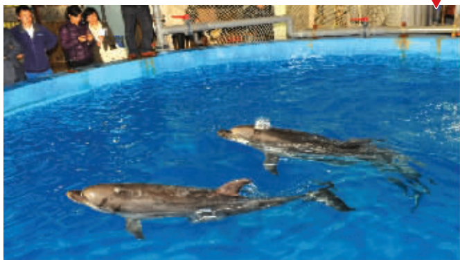
来到新家——南京海底世界,它们开心地游起来