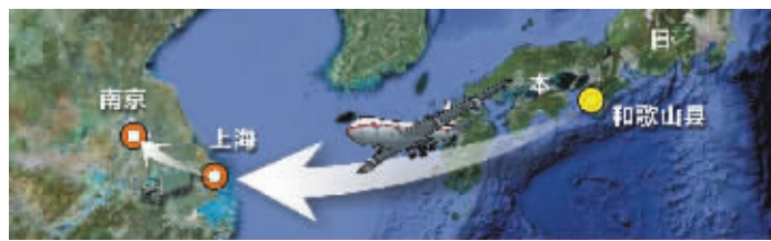
海豚宝宝跨国运输示意图 制图 李荣荣