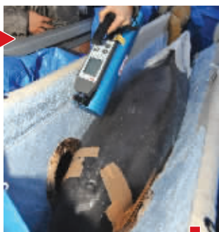
抵达南京,赶紧检测核辐射