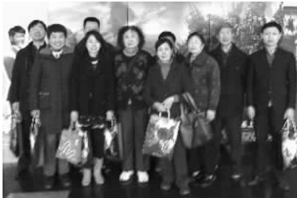
幸运读者昨在新街口国际影城领取了快报颁发的奖品