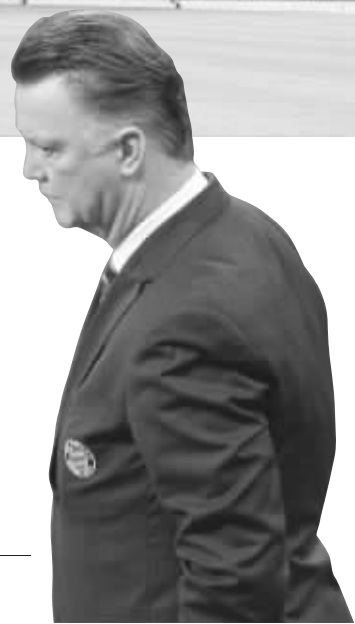
郁闷的拜仁主帅范加尔